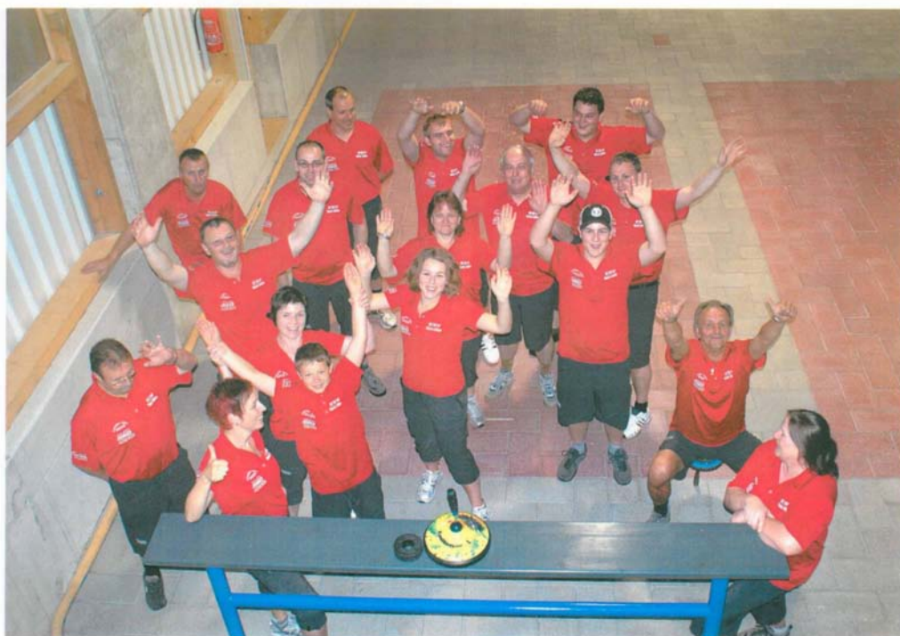
Mannschaft 2009

Als befreundete Vereine in anderen Bundesländern sei Gmünd und Hermagor, beide in Kärnten, erwähnt.